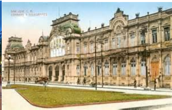
Edificios antiguos como el Teatro Nacional y Correos de Costa Rica