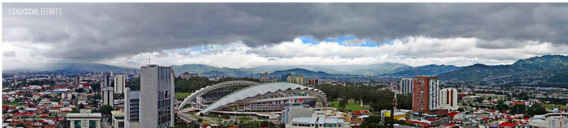
San José, Capital de Costa Rica

TÍTULOS: Conforme a lo estipulado por la FIDE en relación a los Títulos en su sitio ( http://www.fide.com/fide/handbook.html?id=173&view=article ):